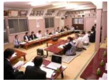
通常総会風景（淀橋会館）

都市計画決定に関するご説明は権利者の全員の方に行うことが目標ですが、事業には賛同をされる方でもこの時点で同意をいただけない方も居られますので、一定以上の方からの同意で都市計画決定に進むこととなります。