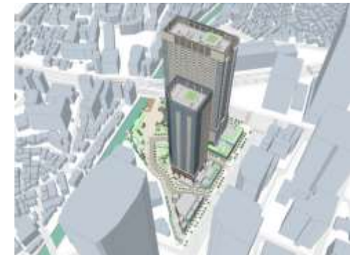
⑥ 南上空から地区全体を望む。