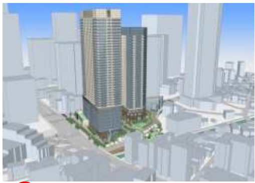
④ 北西から地区全体を望む。