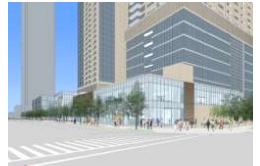
① 十二社通り側外観、低層部の張り出しによるにぎわいの連続

議案 第7号では、街づくりの基本方針を再確認し、スライドを用いて、最新の計画案の説明、パースが公開されました。またスケジュールについての説明もおこなわれました。