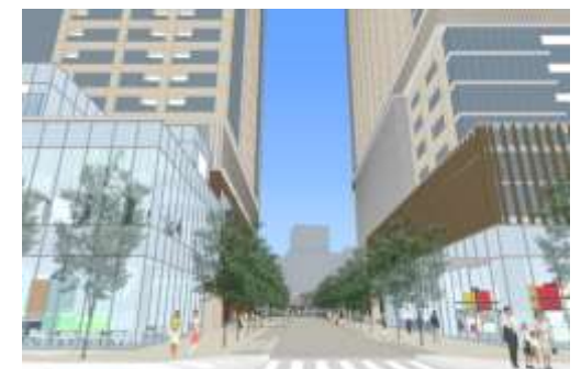
③ 十二社通りから区画道路を望む。