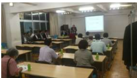
当日の会場の様子