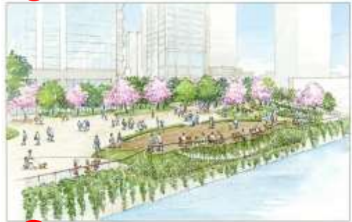
⑤ 神田川から親水公園を望む。